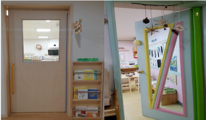
보육실 문 투명창

복도 및 보육실 창은 보육실 외부에서 상시 관찰이 가능하도록 스티커, 반투명, 장식물, 커튼 등 부착 금지