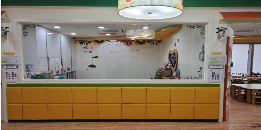
복도에서 통하는 창문