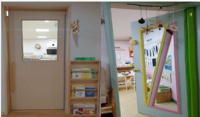
보육실 문 투명창

복도 및 보육실 창은 보육실 외부에서 상시 관찰이 가능하도록 스티커, 반투명, 장식물, 커튼 등 부착 금지