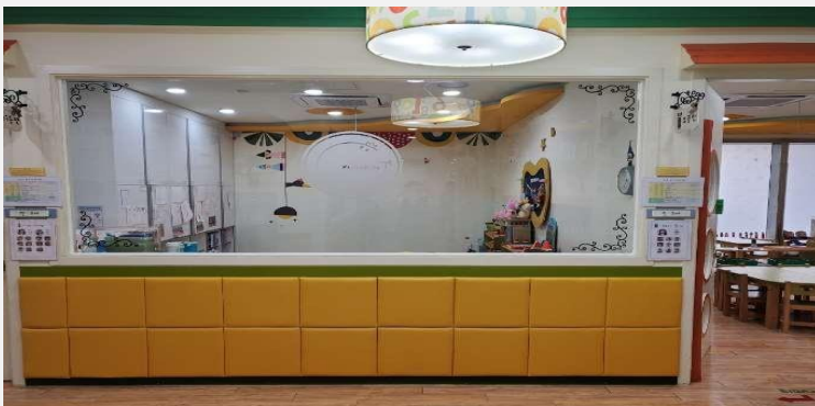
복도에서 통하는 창문